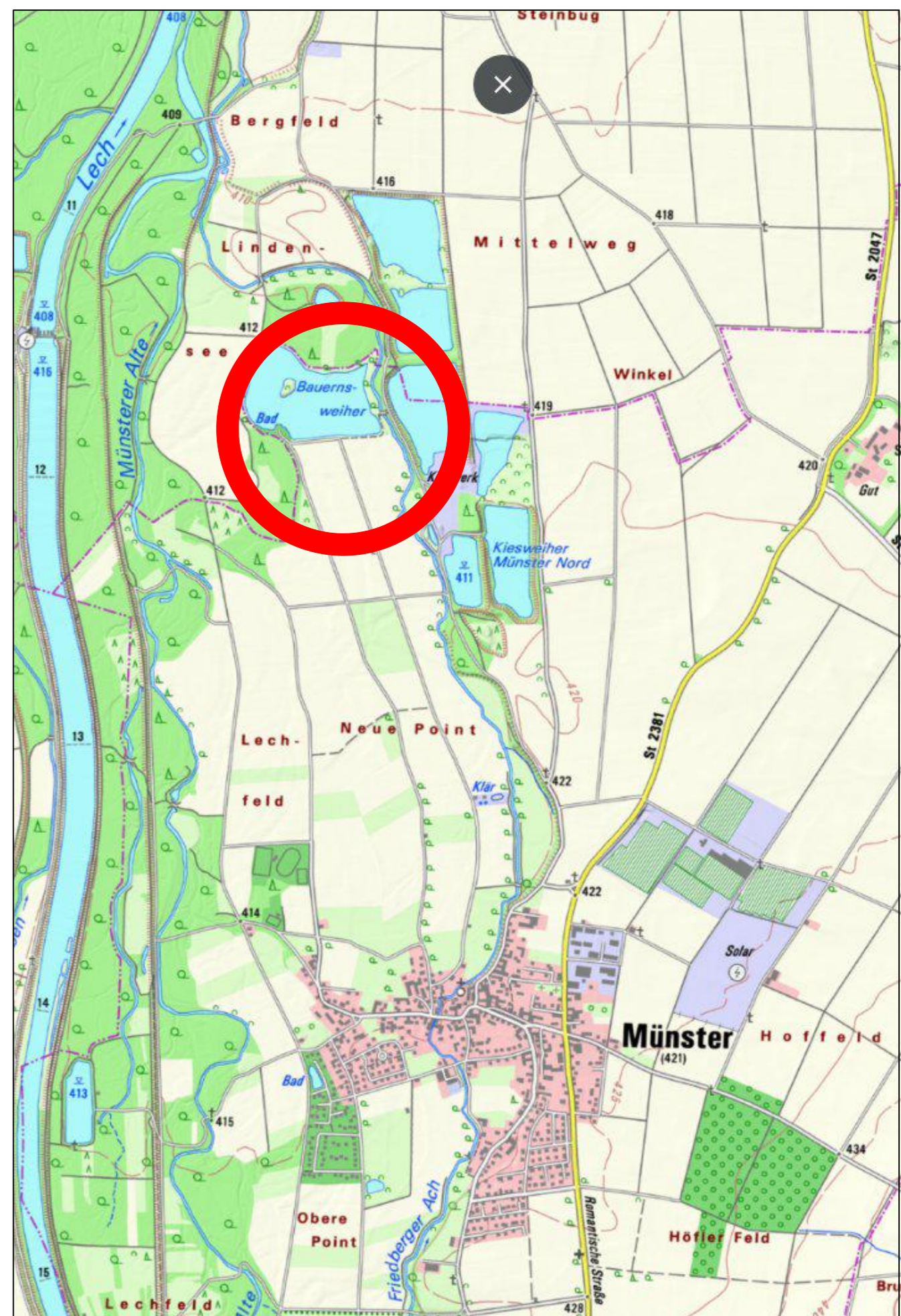
LAGE IM RAUM, AUSZUG AUS DER TOPOGRAPHISCHEN KARTE, o. M.